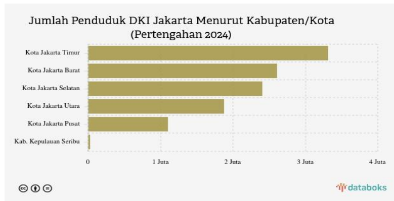
Gambar 1.1 Data Penduduk DKI Jakarta Menurut Kabupaten/Kota

identitas Betawi dalam Pilkada DKI 2024, dalam ranah politik para calon pemimpin tak jarang memanfaatkan simbol simbol budaya Betawi untuk mendekati diri dengan pemilih dan menunjukkan komitmen mereka terhadap pelestarian budaya lokal. Menurut data katadata, sekitar 29% penduduk Jakarta berada di kota Jakarta, dengan Jakarta timur menjadi wilayah jumlah penduduk terbanyak.