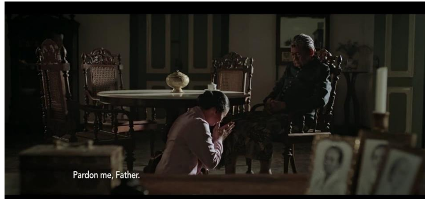
Gambar 10. Kardinah memohon agar tidak dijodohkan

R.M Adipati : Nak, calon suamimu laki-laki yang baik, dia akan menjadi Bupati Pernalang