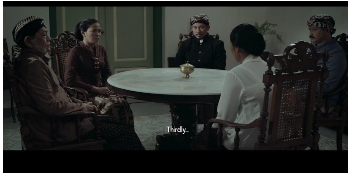
Gambar 13. Kartini menyetujui perjodohnya

Adegan tersebut menunjukkan perjuangan Kartini akan hak-haknya dan orang di sekitarnya. Ia memperjuangkan hak-hak setiap orang untuk mendapatkan pendidikan, hak untuk diperlakukan secara sama antara perempuan dan laki-laki. Emansipasi perempuan yang dilakukan oleh Kartini sangat berarti bagi masyarakat Jepara khususnya perempuan yang merasa hidup mereka dibatasi oleh budaya. Karena setelah menikah Kartini bisa mewujudkan cita-citanya dengan mendirikan sekolah untuk perempuan ataupun masyarakat miskin, sehingga pendidikan bisa dirasakan oleh setiap orang.