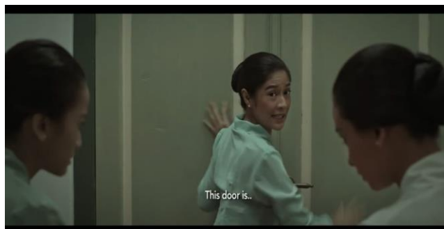
Gambar 4. Kartini Menunjukkan Pintu sebagai Pembatas Dunia Luar