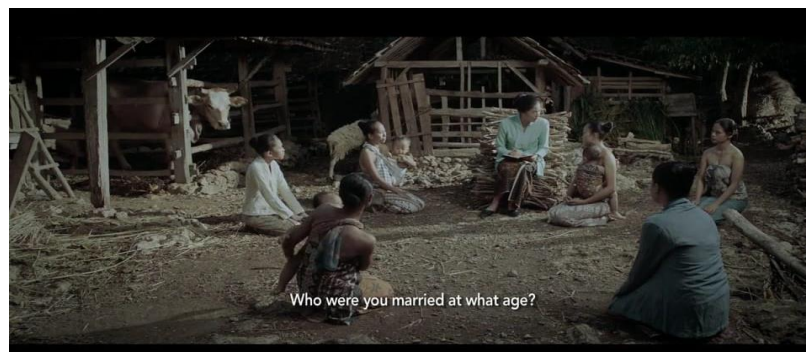
Gambar 8. Kartini Melakukan Survey

Survei yang dilakukan Kartini menunjukkan perjuangannya yang sangat nyata terhadap visinya. Visi Kartini yang ingin mendirikan sekolah khusus perempuan yang sebagai sarana bagi pemberdayaan perempuan. Tekad Kartini sangat kuat untuk mendirikan