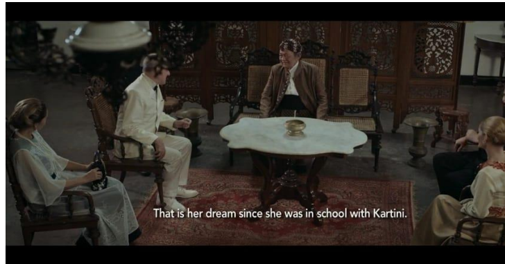
Gambar 5. Kediaman Kartini Kedatangan Tamu