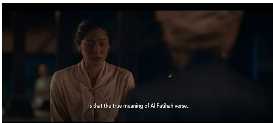
Gambar 9. Kartini Menanyakan Tentang Ilmu

Kartini : Apakah ada surah dalam Al-Quran yang membahas tentang ilmu?