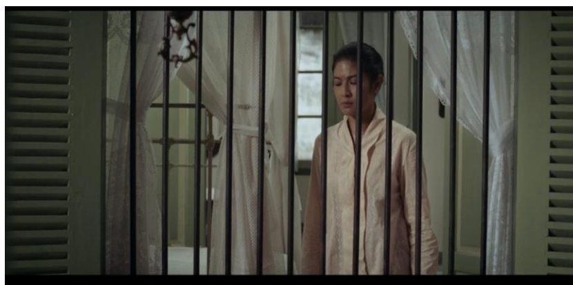
Gambar 2. Kartini dikurung karena Masa Pingitan

Adegan tersebut menandakan adanya perubahan status sosial dari Kartini. Masa pingitan menunjukkan bahwa adanya keterbatasan perempuan berhubungan dengan lingkungan sosialnya. Pingitan juga membatasi hak dan kewajiban perempuan untuk berinteraksi, karena perempuan yang memasuki masa pingitan mereka harus dikurung di suatu ruangan dan aktivitasnya juga dibatasi. Adegan tersebut menunjukkan kekentalannya budaya patriarki yang berlaku di masyarakat Jawa. Perempuan dilarang untuk melakukan hubungan interaksi sosial yang seharusnya menjadi hak dan kewajiban yang didapatkan setiap orang. Kartini tidak boleh keluar dari kamarnya, kecuali mereka melakukan aktivitas yang penting dan masih dilakukan di dalam rumah. Mereka tidak boleh keluar rumah sampai mereka mendapat lamaran atau saat pelaksanaan ijab kabul. Apalagi Kartini yang merupakan keturunan ningrat maka saat ia pubertas Kartini harus dikurung di dalam rumah, hal tersebut juga dilakukan untuk mendapatkan gelar Raden Ayu atau Raden Ajeng. Kartini merasa budaya pingitan yang ditetapkan kepada perempuan tidaklah adil, ia menganggap bahwa pingitan tersebut menyimbolkan pengekangan yang membatasi ruang gerak perempuan.