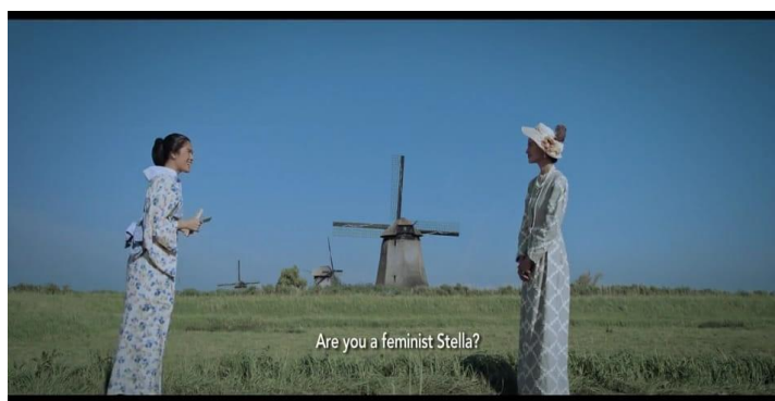
Gambar 7. Kartini Mengirimkan Surat Kepada Stella

Kartini : Stella? Apakah kamu seorang Feminis Stella?