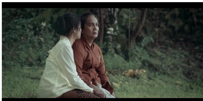
Gambar 12. Kartini diberi wejangan oleh Ngasirah

Adegan tersebut menunjukkan bahwa adanya tindakan yang menggambarkan perjuangan individu untuk melawan struktur sosial yang mengekang kebebasan bagi perempuan. Kartini yang memiliki harapan untuk melakukan perubahan sosial dan emansipasi perempuan dengan pendidikan. Namun ekspektasi yang tidak sejalan dengan kenyataan bahwa budaya patriarki dan norma-norma yang berlaku di masyarakat masih membatasi keinginannya. Begitupun dengan Ngasirah yang menggambarkan sosok ibu yang memiliki kasih sayang yang besar dengan anaknya, walaupun ia dianggap sebagai orang asing di dalam keluarganya, karena dibatasi oleh kelas sosial yang berlaku di masyarakat. Ngasirah juga menunjukkan perlawanan terhadap budaya patriarkal yang masih mendarah daging di masyarakat Jawa. Ngasirah menganggap bahwa mengurung seseorang karena memberontak melawan tradisi merupakan tindakan yang salah, seharusnya mereka menyelesaikan masalah bisa dengan melakukan dialog dan pendekatan yang lebih manusiawi tanpa adanya hukuman dan kekerasan.