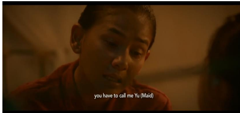
Gambar 1. Kartini ingin tidur dengan Ngasirah (Ibu Kandung Kartini)